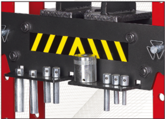
A-5552/15: Para prensas de 15 t. A-5552/30: Para prensas de 30 y 50 t. Adaptador y mandrinos. Ø30 25 22 20 18 16 12

La bandeja portamandrinos es de serie en las prensas de suelo pero el juego de mandrinos es opcional .