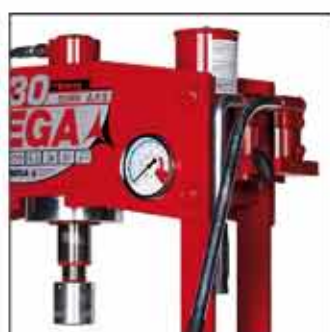
BKD-09: Bomba de 2 velocidades. Para modelos KCK-30 y KCK-50.

Husillo extensible para un acercamiento más rápido y preciso a la posición de trabajo.