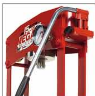
BK-05: Bomba de una velocidad.

Fabricamos prensas en dos versiones: modelos KMG y KSG con conjunto hidráulico monobloc y modelos KCK y KSC con bomba y cilindro independientes.